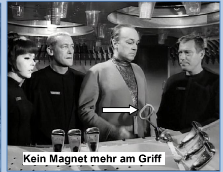
Kein Magnet mehr am Griff

Auch ein Fehler aus der letzten Folge: General van Dyke trägt nach dem Angriff der HYDRA auf die ORION, ihre ID-Plakette verkehrt herum. Bei der Beförderung McLanes zum Oberst, hat sie die Plakette richtig herum.