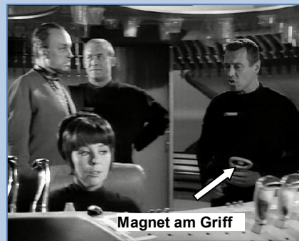
Magnet am Griff